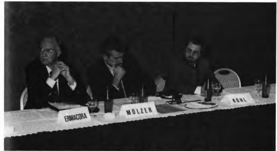
„Freiheitliche Eliten“ bei der Festakademie des FBW, Hotel Penta, Salzburg, 25. Oktober 1992.

Der Aufstieg der freiheitlichen Partei unter Bundesparteiobermann Jörg Haider stellt für Österreich die tiefgreifendste politische Wandlung seit Ende des II. Weltkrieges dar. Wesentliche, bis dahin unantastbare Dogmen der II. Republik gerieten ins Wanken. In außenpolitischer Hinsicht wurden Zweifel an der sogenannten immerwährenden Neutralität nun erstmals offen diskutiert und in der Innenpolitik wurde der „Kammer- und Verbändestaat“ unter sozialpartnerschaftlicher Führung kritisiert.