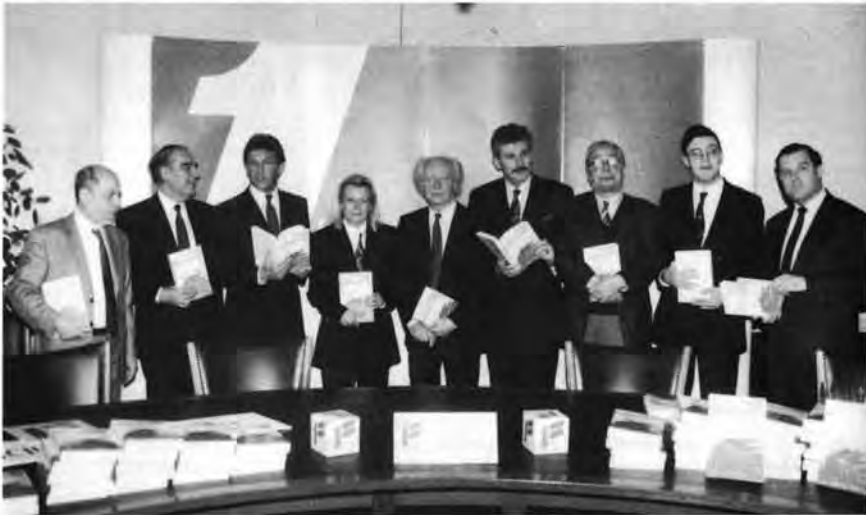
Präsentation des „Jahrbuches für politische Erneuerung 1993“ des Freiheitlichen Bildungswerkes

Neben den traditionellen Aufgaben des Freiheitlichen Bildungswerkes, wie Schulung und Ausbildung von Funktionären und Mitarbeitern der Partei, entfaltet die politische Akademie der FPÖ auch eine rege publizistische Tätigkeit, um den vorhin genannten Anliegen besser gerecht zu werden.