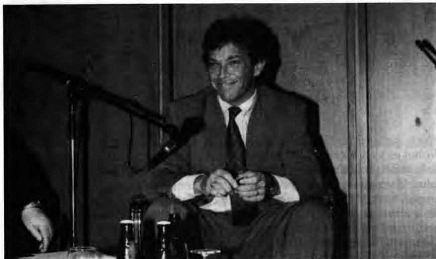
Jörg Haider beim Symposium „Multikulturelle Gesellschaft oder Ethnopluralismus – Österreich ein Einwanderungsland oder Recht auf Heimat?“, 21. 1. 1993.

Freiheitliche Bildungsarbeit hat nichts mit Indoktrination oder parteipolitischer Engstirnigkeit zu tun. Vielmehr sehen wir im selbständigen Erarbeiten einer politischen Meinung eines der wichtigsten Ziele unserer Tätigkeit. Wir wollen junge Menschen im Geiste der kritischen Wahrheitssuche für die Herausforderungen der Zukunft wappnen und so mithelfen, dieses Land zu reformieren.