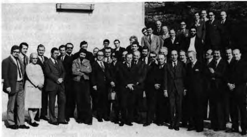
Bezirksrätekonferenz 16./17. Februar 1974, Haus Baden

Bereits in einem früheren Aufsatz habe ich auf die Schwierigkeiten beim Ausbau des Bildungswerkes hingewiesen und die unterschwelligsten Töne der Kritik, „ob das Ganze gut ausgehen wird“ usw. aufgezeigt. In diesem Sinne muß doch auf die Größe und Bedeutung einer zeitgerechten Erziehungspolitik und Erziehungsarbeit eingegangen werden. Die rasche Entwicklung auf fast allen Gebieten des menschlichen Lebens macht es unmöglich, daß ein Mensch mit dem Wissen der Berufsausbildung des Jahres 1993 ein ganzes Leben auskommt. Was bisher bereits für den Arzt, Chemiker, Lehrer, Techniker galt, umfaßt heute praktisch alle übrigen Berufe. Niemand findet mehr mit einer abgeschlossenen Schul- und Berufsausbildung das Auslangen und die Weiterbildung wird das Grundprinzip moderner Bildungsarbeit. Das gilt ganz besonders für die politische Bildung, wo von klein auf die differenzierten Erscheinungsbilder zu einem ständigen Wechsel der Entscheidungsfindung zwingen.