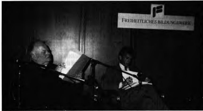
„Multikulturelle Gesellschaft oder Ethnopluralismus – Österreich ein Einwanderungsland oder Recht auf Heimat?“ Eine Diskussionsveranstaltung des FBW am 21. 1. 1993 in Graz mit Weihbischof Kurt Krenn, Jörg Haider, Andreas Mölzer und Günther Nenning.