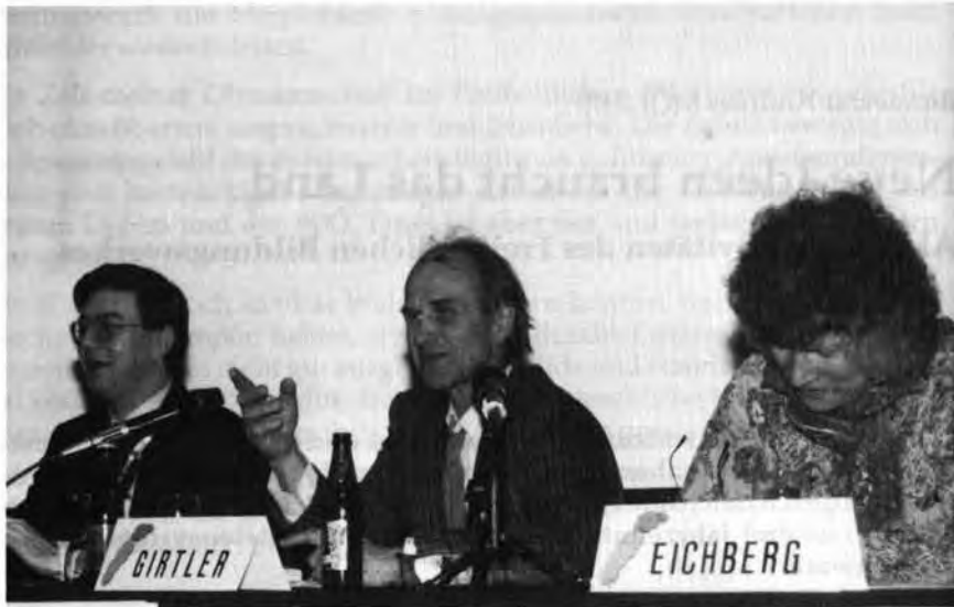
Symposium „Multikulturelle Gesellschaft oder Ethnopluralismus – Österreich ein Einwanderungsland oder Recht auf Heimat?“, Graz, 21. 1. 1993.