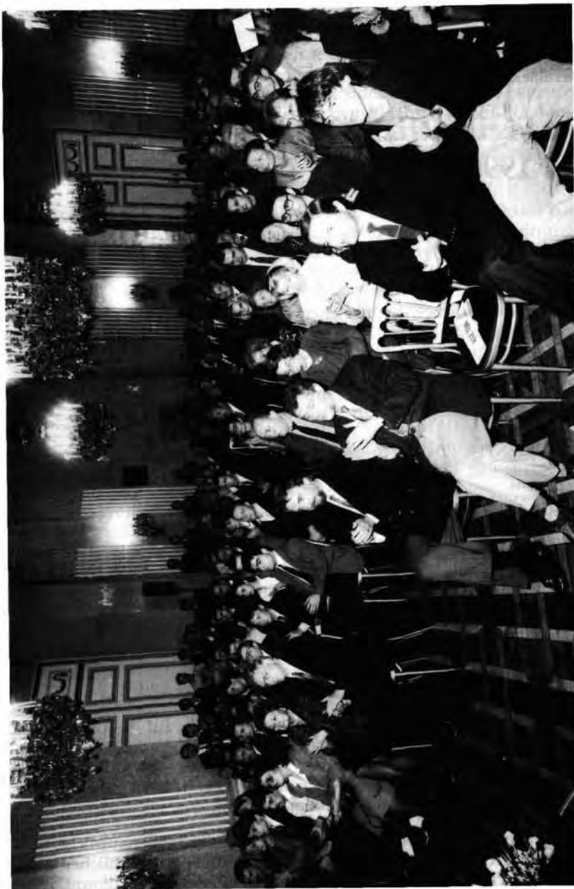
Eine Veranstaltung des FBW im Palais Palfy.

Während meiner Tätigkeit als Geschäftsführer des Freiheitlichen Bildungswerkes, ohne das unsere politische Arbeit wohl nicht mehr vorstellbar wäre, hatte ich von Jänner bis November 1990 Gelegenheit, die in dieser Institution geleistete Arbeit näher kennenzulernen und mich intensiver an ihr zu beteiligen.